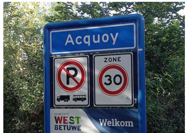
Acquoy een plaatsje in gemeente West Betuwe

Organisatie en vrijwilligers, bedankt voor de goede verzorging onderweg. Het was een mooie tocht!