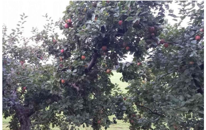
Volop appels aan deze boom