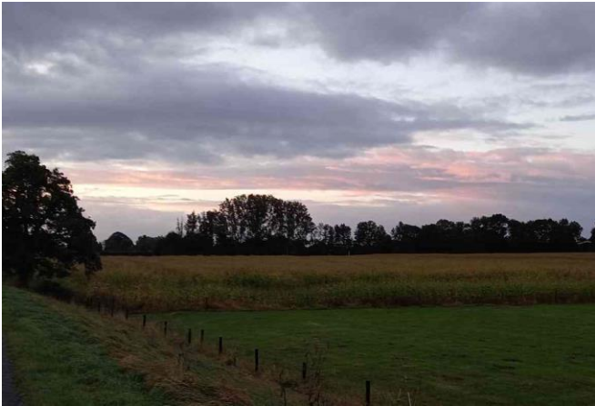
De nieuwe dag is begonnen

Als we weglopen uit de sportkantine is het nog donker. 'Meestal rond 6.45 uur begin het nu te gloren', weet Mark. Hij vertrekt dan op werkdagen richting zijn werk. Inderdaad, rond 7.00 uur kunnen we zonder zaklamp zien waar we wandelen. 'Lekker, die appeltjes', zeg ik. Jako knikt. We lopen langs een boomgaard waar volop appels aan de bomen hangen. Tja, De Betuwe wordt niet voor niets de fruittuin van Nederland genoemd. De bekende appel Kanzi is in de Betuwe ontwikkeld.