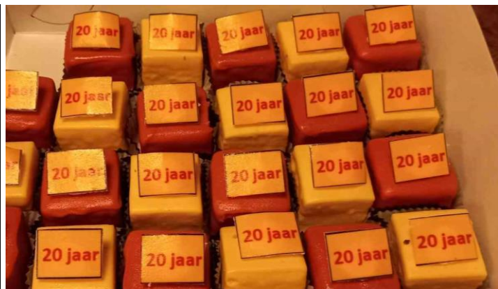
Gebak ter ere van de 20 e editie van KM Leerdam