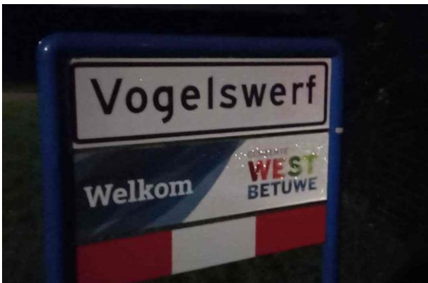
Vogelswerf, een buurtschap van Heukelum langs de Linge